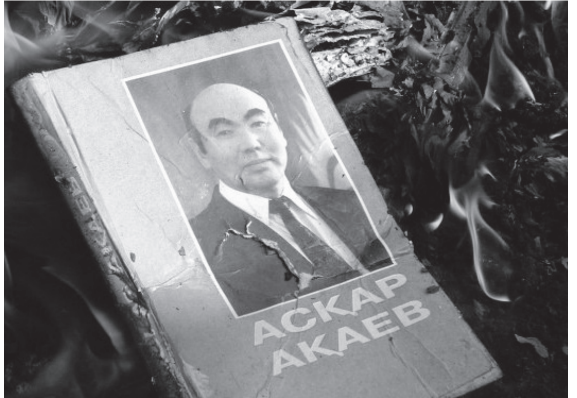
Аскар Акаев китеби, 2005-жыл