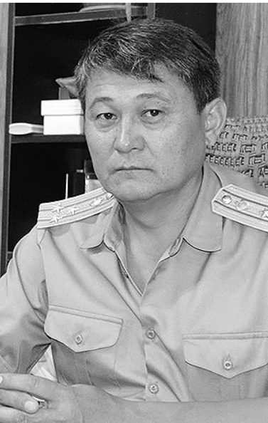
тинде кайрылган болсо, биз аларды коштоп берүүгө даярбыз.

Жогоруда саналгандарды коштоп жүрүүгө кошумча акы алынбайт. Бул биздин негизги кызматыбыздын алкагындагы эле жумуштардын бири. Коштоп жүргөн кызматкерлер коштолуп бара жаткан транспортту жана ичиндеги адамдын сактыгына жоопкер болушат. Кошумча айлык маяна, же акча берилбейт. Мамлекет тарабынан күнүмдүк патрулдук ишибизди кылганга каражат алынат. Транспортту ондоого, күйүүчү майга, кызматкерлердин командировкаларына бөлүнүп берилет.