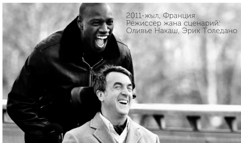
2011-жыл, Франция Режиссер жана сценарий: Оливье Накаш, Эрик Толедано

Дагы бир эпизодунда болсо француз аксөөк Филиппти классикалык музыкага жакындаткысы келет, бирок көчөнүн даамын татып калган Дрисс аны четке кагып “Бийлете албаган музыка да музыкабы?” деп ага азыркы шаңдуу музыкадан коюп алып шылкылдап бийлеп берет. Албетте, француздар бир жактан операларга барып, классикалык музы-