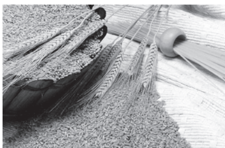
Бүгүнкү күнгө карата бардык дан кабыл алуу пункттары буудай кабыл алууга даяр.

Республиканын бардык аймактарында дан даярдоочу такай иштеген пункттар иш алып барат. Нарын облусунун Нарын шаарында жана Ысык-Көл облусунун Каракол шаарында буудай данын даярдоо үчүн убактылуу пункттар уюштурулган, кийинчирээк чогултулган дан Мамлекеттик материалдык резервдер фондунун аймактык ишканаларынын жоопкер жактары аркылуу өз алдынча ташылып кетет.