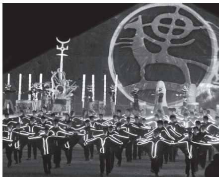
Улуттук өзгөчөлүктөрү боюнча спорттук мелдештер жана салттуу интеллектуалдык оюндар бар.

Эквадор жана Эстония тастыкташты. Учурда чет мамлекеттерден ДКО-2016-га катышуу тууралуу табыштамаларды кабыл алуу уланууда. Маалымат катары: Дүйнөлүк көчмөндөр оюндарын өткөрүү тууралуу жобого ылайык, спорттук мелдештерге катыша турган мамлекеттер акыркы табыштамаларын ушул жылдын 7-августуна чейин жөнөтүшү керек. II Дүйнөлүк көчмөндөр оюндары ушул жылдын 3-8-сентябрында Ысык-Көлдө өтөт. Мелдештердин программасында спорттун 23 түрү бар. Анын ичинде ат чабыш жана ат оюндары боюнча мелдештер, күрөш, жаачылардын салттуу жаа атуу мелдештери, мергенчиликтин