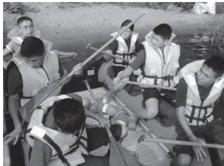
Кыргызстан үчүнчү, Болгария экинчи, Польша биринчи орунду багынтыкан.

Жалпы жыйынтык боюнча Орусиянын командасы 1-орунду, Беларусиянын командасы 2-орунду, Азербайжандын командасы 3-орунду, Казакстандын командасы 4-орунду, Кыргызстандын командасы 5-орунду, Сербия алтынчы, Польша жетинчи, Болгария болсо сегизинчи орунду алды. Ал эми маданий конкурстардан жалпы эсеп менен Кыр-