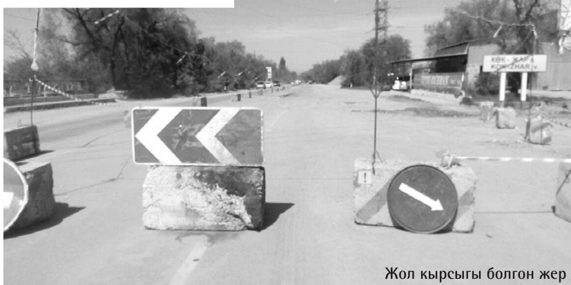
Жол кырсыгы болгон жер