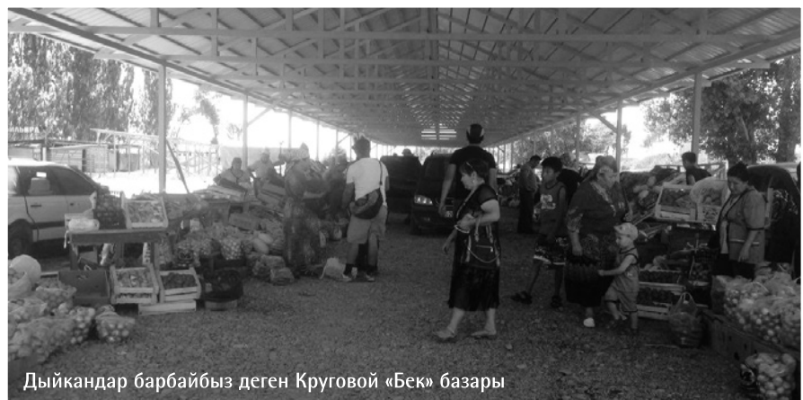
Дыйкандар барбайбыз деген Круговой «Бек» базары

– Азыркы күнү ал жерде соода-сатык кылууга уруксат берилбейт деп Чүй облусунун МАИлери айтышты. Ошол себептен соода кылууга болбойт. Бирок ошол эле жерде базар бар. Жолдун жээгине турбай, базардын ичинде соода кылгыла десек көнбөй жатат. Себеби турган орунга акча төлөш керек. Булар бүт министрликтерге кайрылды. Алар эми текшерип жатат. Базар мыйзамсыз болсо