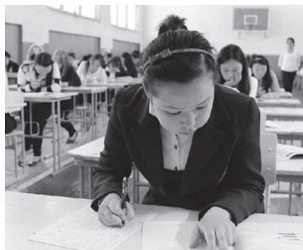
денттерге караганда туруктуу, жогорку маянага ээ болушкан.

Окууга өтпөй калган абитуриенттер орто билим берүүчү кесиптик окуу жайларга тапшырса болот. Кийинки жылдардын статистикасы көрсөткөндөй, коллеждерге өткөн студенттердин пайызы 47 пайызга жеткен. Окууларын бүткөндөн кийин бардыгы жумуш менен камсыз болуп, ЖОЖдо окуган сту-