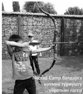
Nomad Camp балдарга көчмөн турмушту үйрөткөн лагер

Негизги программабыз 10дон 14 жашка чейинки мектеп окуучуларына багытталган. Бул өзүнчө эле билим берүү лагери. Бирок биздин билим дегенибиз салттуу билимдерди билдирет. Мисалы, кыргыздын байыркы жазуусун түшүндүрүп, балдар өзүнүн аты-жөндөрүн, санжырасын байыркы рун жазуусу менен жазып көрүшөт. Манас баатырдын, Эр Төштүктүн жана башка кыргыз баатырларынын эрдиктери жөнүндө айтып беребиз. Мастер класстарда ат токуганды, мингенди, жаа атканды үйрөтөбүз. Музыкалык аспаптардан чопо чоор кан-