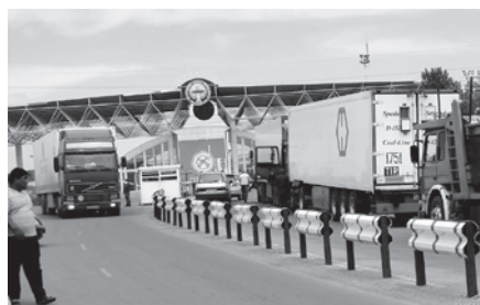
салынган инвестициялардын көлөмү 39 млрд. сомду түзгөн.

Улуттук статистика комитети ушул жылдын январь-июнь айынын отчетун берди. Маселен, ички дүң өнүмдүн көлөмү алдын-ала баалоо боюнча 176 млрд. сомду түзүп, өткөн жылдын тийиштүү мезгилине салыштырганда, 2,3%га төмөндөгөнү белгилүү болду. Ошондой эле, “Кумтөр” кен казуу ишканасын эсепке албаганда, алты айдын жыйынтыгында 1,2%га көбөйгөн. Мындан тышкары, айыл-чарба дүң продукциясы да 2,9% өскөн. Негизги капиталга