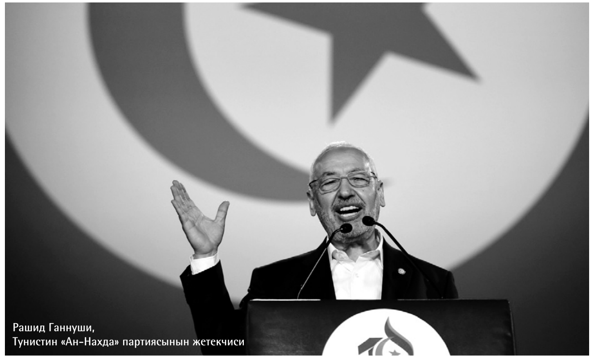
Рашид Ганнуши, Тунистин «Ан-Нахда» партиясынын жетекчиси

Куранда да, Пайгамбарыбыз Мухаммаддын өмүр таржымалында да башкаруунун кандайдыр бир түрү айтылган эмес. Пайгамбарыбыздын доорунда ислам мамлекети деген түшүнүк болгон эмес. Пайгамбарыбыздан кийинки халифалардын бири кыйыр дайындалса, кийинкиси тандалып, үчүнчүсү шайланып атат. Бул тез өнүгүп, кеңейип бараткан мамлекеттеги бийликке келүү усулдары болгон. Эгер башкаруунун жалгыз эффективдүү формасы болсо, Жараткан менен түз байланышы болгон Пайгамбарыбыз ал тууралуу кенен маалымат калтырмак. Демек адамга коомдун өнүгүүсүнө жараша башкаруусун жакшыртуу жоопкерчилиги жүктөлгөн. Кайсыл бир мусулман же жамаат башкаруу сөзсүз мындай болуш керек деген болсо, заманбап коомдун эң оптималдуу