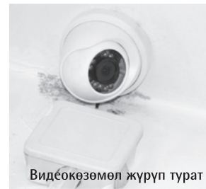
Видеокөзөмөл жүрүп турат