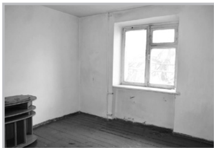
Цирктин жатаканасындагы талашка түшкөн бөлмө