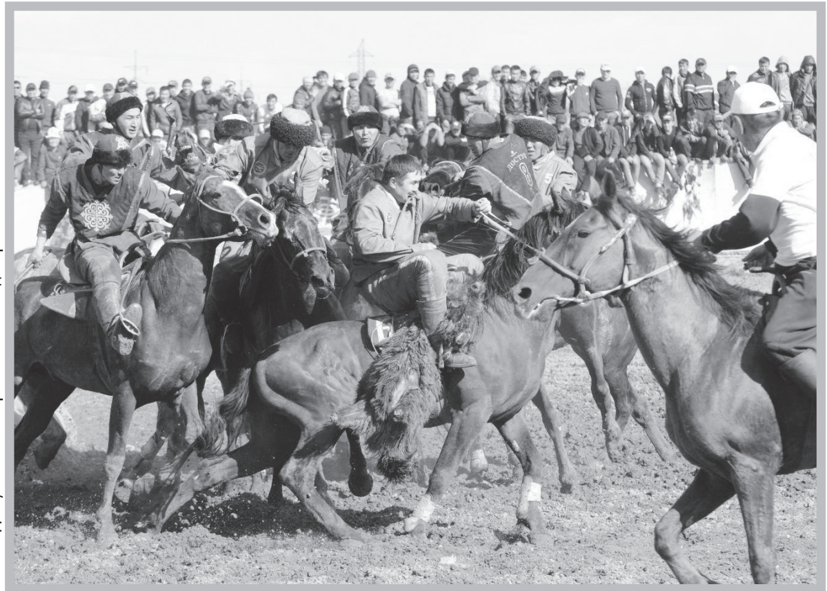
Финал: “Достук” менен “Сары-Өзөн” командалары

Ошону менен көптөн күткөн “Достук” менен “Талас” оюну старт алды. Мелдеш алгачкы мүнөттөн тарта курч мүнөздө өттү десек болот. Эки команда тең жан үрөп ойноп жатты. Акыры “Достуктун” атактуу оюнчусу