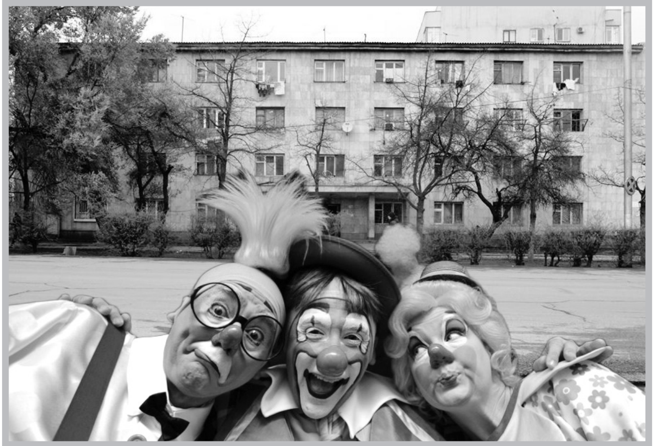
Мамлекеттик цирктин жатаканасы

тирде турчумун. Кийин төлөбөй калганымда чыгарып салды. Анан мен ушул жерде жашайм го деп ойлогом. Көрсө, бул жерде мындай окуя болуп жатыптыр. Мен өзүм урушчаак аял эмесмин. Бирок бул жакка жашаганга мажбурмун. Анткени бара турган жерим жок. Циркке кичинекей балам менен келгем. 1966-жылдан бери расмий түрдө иштеп келем”.