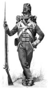
Королдук ирланд полкторунун 3014 аскери