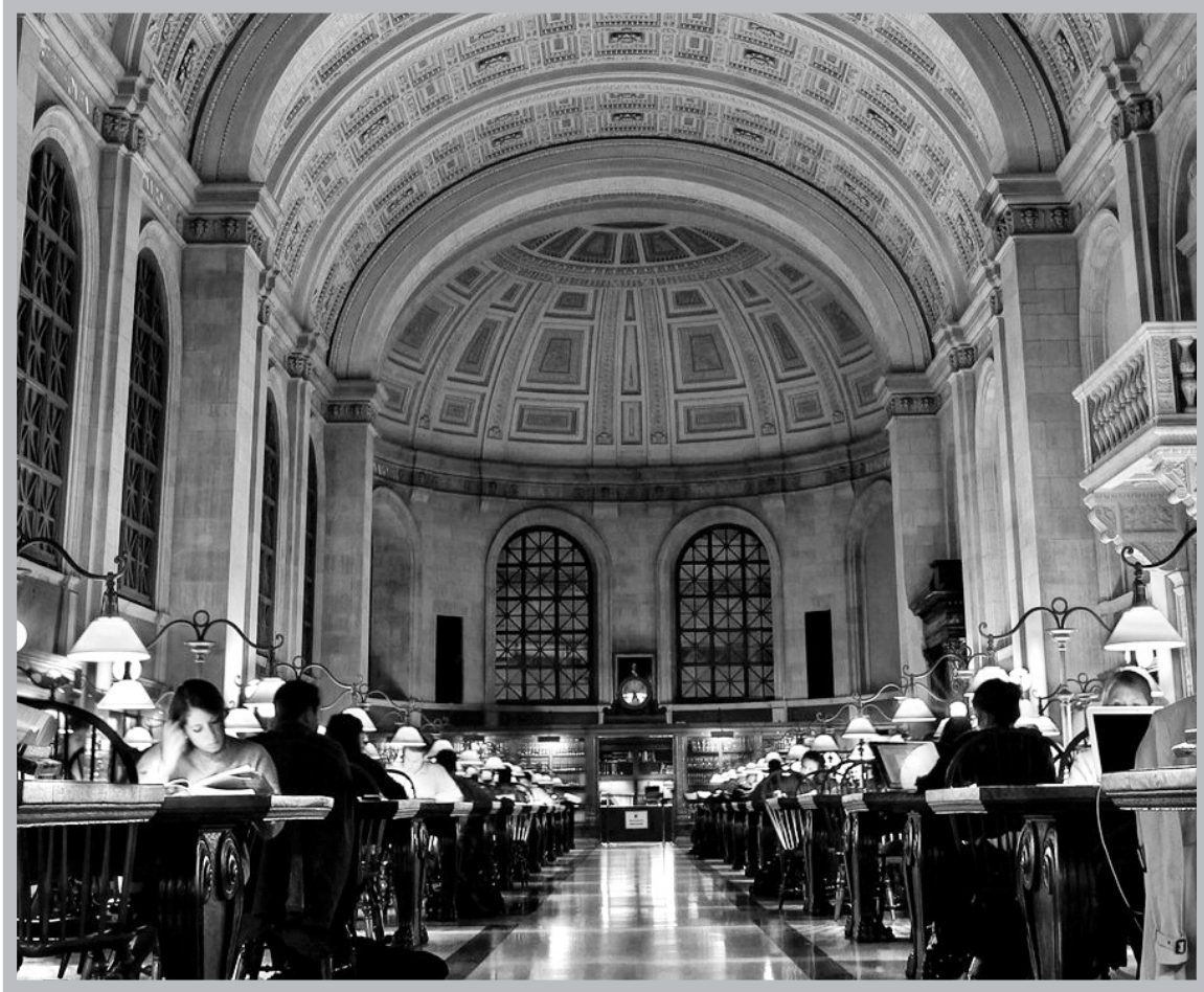
Бостон коомдук китепканасы - АКШдагы жеткиликтүү ири китепканалардан