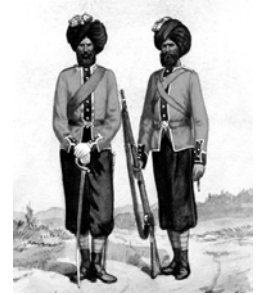
Индиядан 1080 жалданма аскер

жүрөктөрү кабынан чыгып кете жаздап, качууга мажбур болушкан. Англисттер Бээжинге азык-түлүк алып барган бардык жолдорду бөгөшкөн. Алапайын таппай калган кытай императору британдыктарга элчинин аркасынан элчи жибере баштаган.