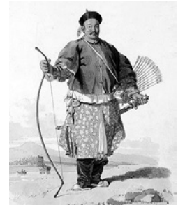
«Сегиз байрактүү армиясынын» 220 000 манжу аскер