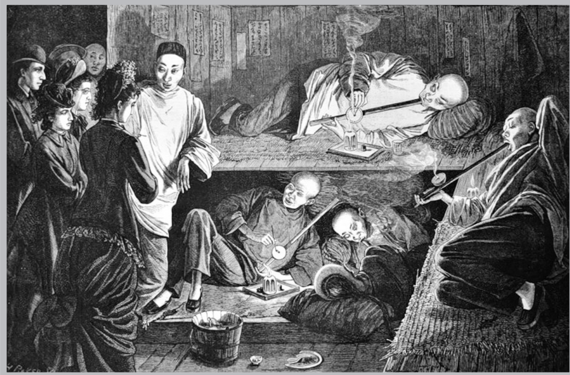
XIX кылымдагы кытайлыктардын апиийм чегүүчү жайы