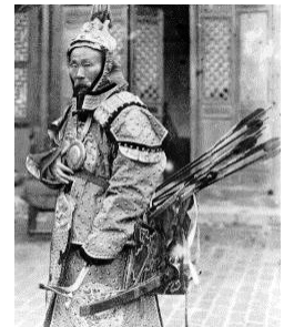
«Жашыл байрактүү армиясынын» 660 000 хань аскер