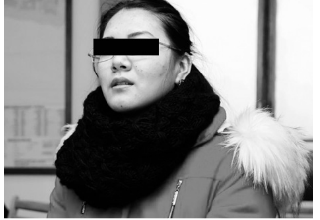
Коомдук тартипти бузган жаштар