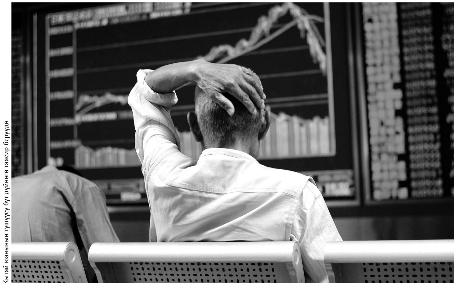
Кытай юанынын түшүүсү бүт дүйнөгө таасир берүүдө