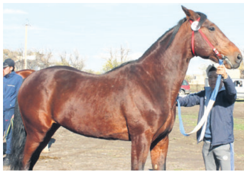
1-орунду ээлеген Лоран аттуу жылкы