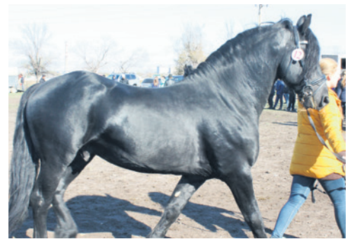
Меркель аттуу оор жүк ташуучу жылкысы