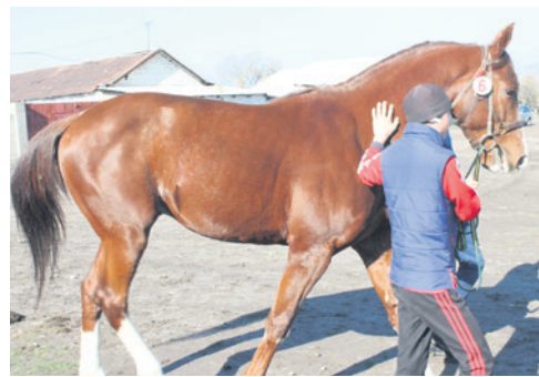
2-орун. Бест-тайм аттуу жылкы