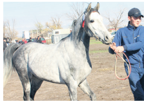
Гудрон аттуу араб таза кандуу жылкысы