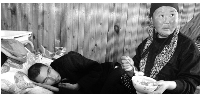
Айгүл селсаяк майып болгон күйөсүн багууда