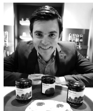
«Jam boy» аттуу миллионер Фрейзер Доэрти

Жумушсуздукту азайтуу үчүн мамлекеттер бир канча аракеттерди жүргүзүп келишет. Алсак, Швед