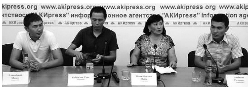
«Визит тур» фирмасынан жабырлангандар

2014-жылы АКШ элчилигинен үч миңден ашуун Кыргызстандын жараны виза алган. Виза алуудагы кыйынчылыктардан улам жарандар түрдүү менчик компанияларга кайрылып, атүгүл алардын жардамы менен кеткендер тууралуу пикирлер коомчулукта айтылып келет. Бул айтылган кептер чындыкка дал келбегени эми так билишип отурат. АКШга кетүүгө виза алуу үчүн документтерге 160 доллар кетет. 160 долларды төлөгөн жаран 100% АКШга кетем деп ойлобошу керек. Эч ким кетээрине кепилдикти бере албайт.