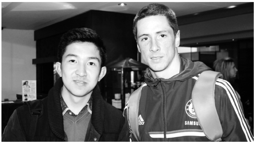
Алманбет Турдубеков Фернандо Торрес менен