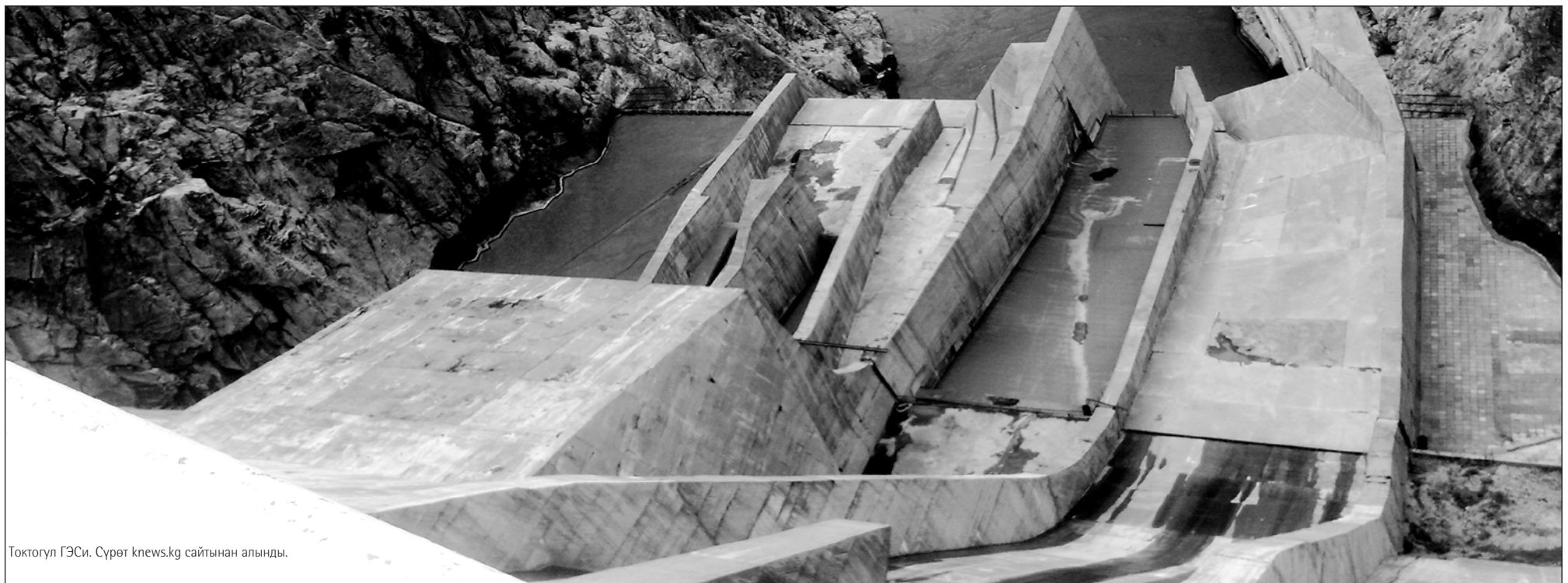
Токтогул ГЭСи.